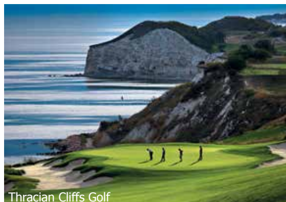
Thracian Cliffs Golf