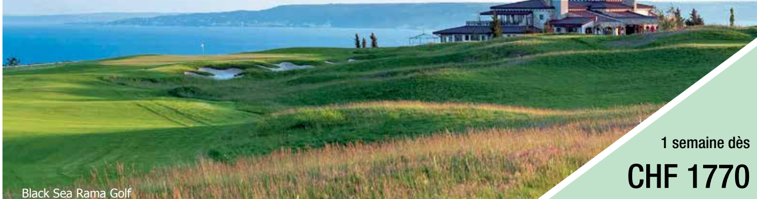
Black Sea Rama Golf