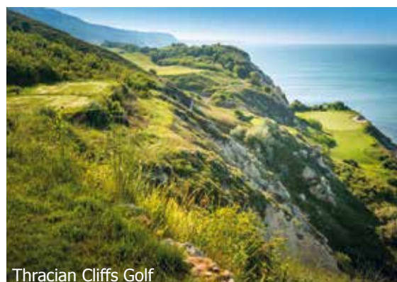
Thracian Cliffs Golf

IMPORTANT: Nombre limité de billets d'avion aux conditions ci-dessus. Si la classe de réservation calculée n'est plus disponible, nous nous réservons le droit d'ajuster une éventuelle surcharge de vol. Réserver de bonne heure vaut la peine! nb400/0