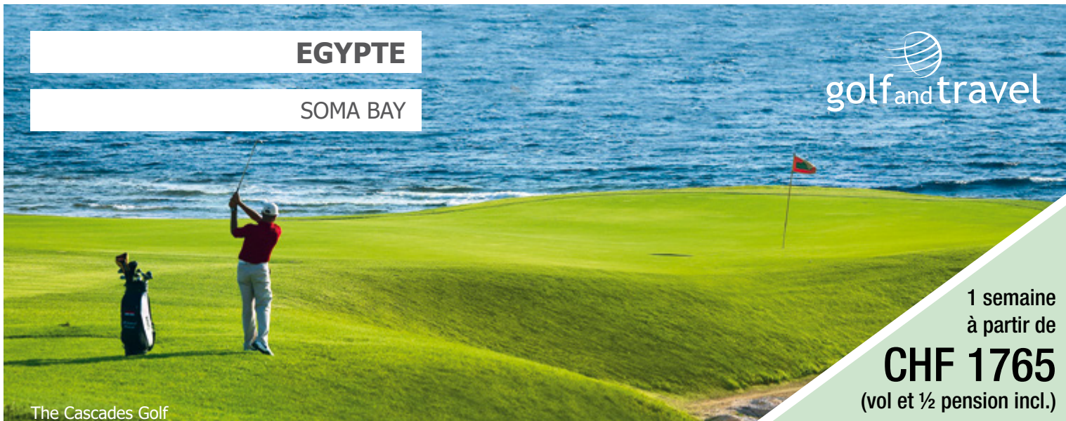
The Cascades Golf