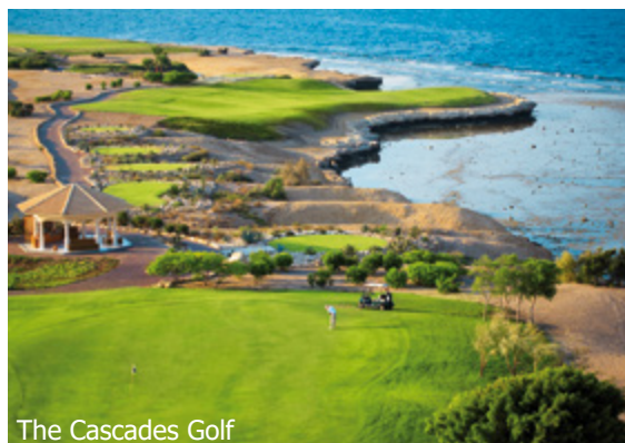
The Cascades Golf