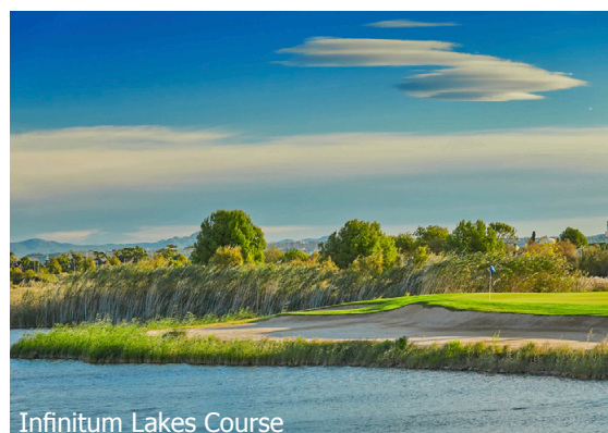
Infinitum Lakes Course

IMPORTANT: Nombre limité de billets d'avion aux conditions ci-dessus. Si la classe de réservation calculée n'est plus disponible, nous nous réservons le droit d'ajuster une éventuelle surcharge de vol. Réserver de bonne heure vaut la peine! nb250/200