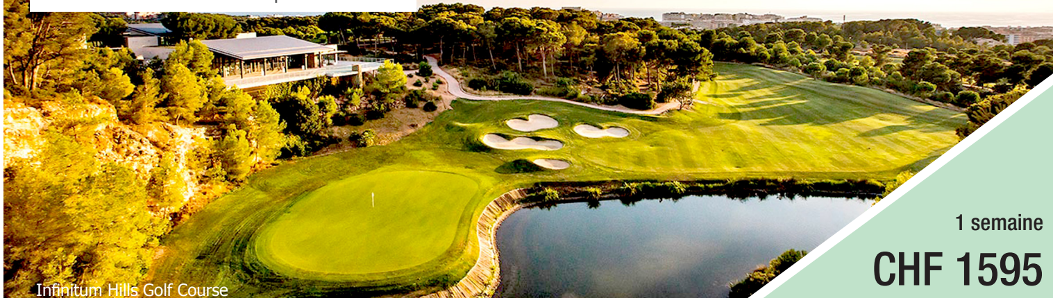
Infinitum Hills Golf Course