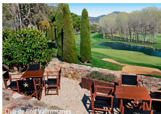
Club de Golf Vallromanes

IMPORTANT: Nombre limité de billets d'avion aux conditions ci-dessus. Si la classe de réservation calculée n'est plus disponible, nous nous réservons le droit d'ajuster une éventuelle surcharge de vol. Réserver de bonne heure vaut la peine! nb200/250