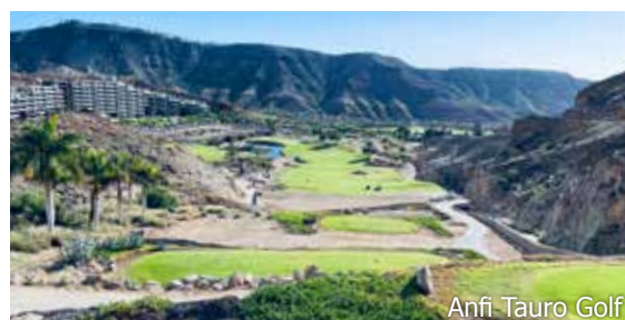
Anfi Tauro Golf