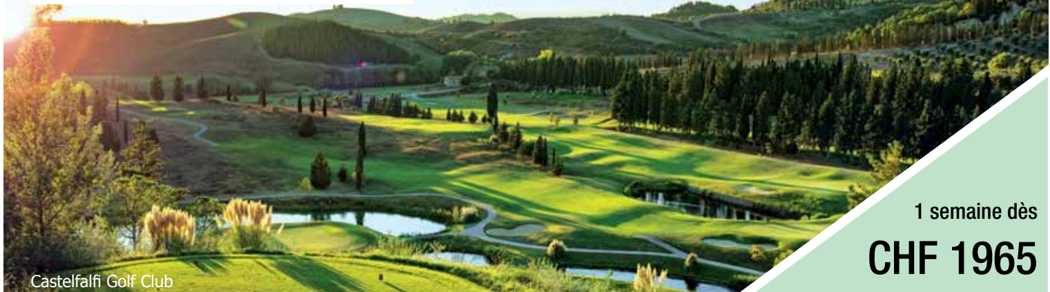
Castelfalfi Golf Club