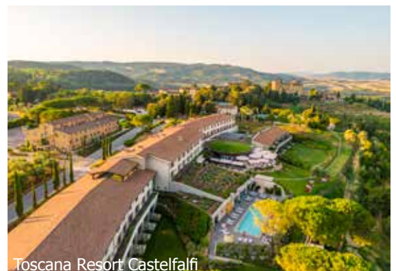
Toscana Resort Castelfalfi