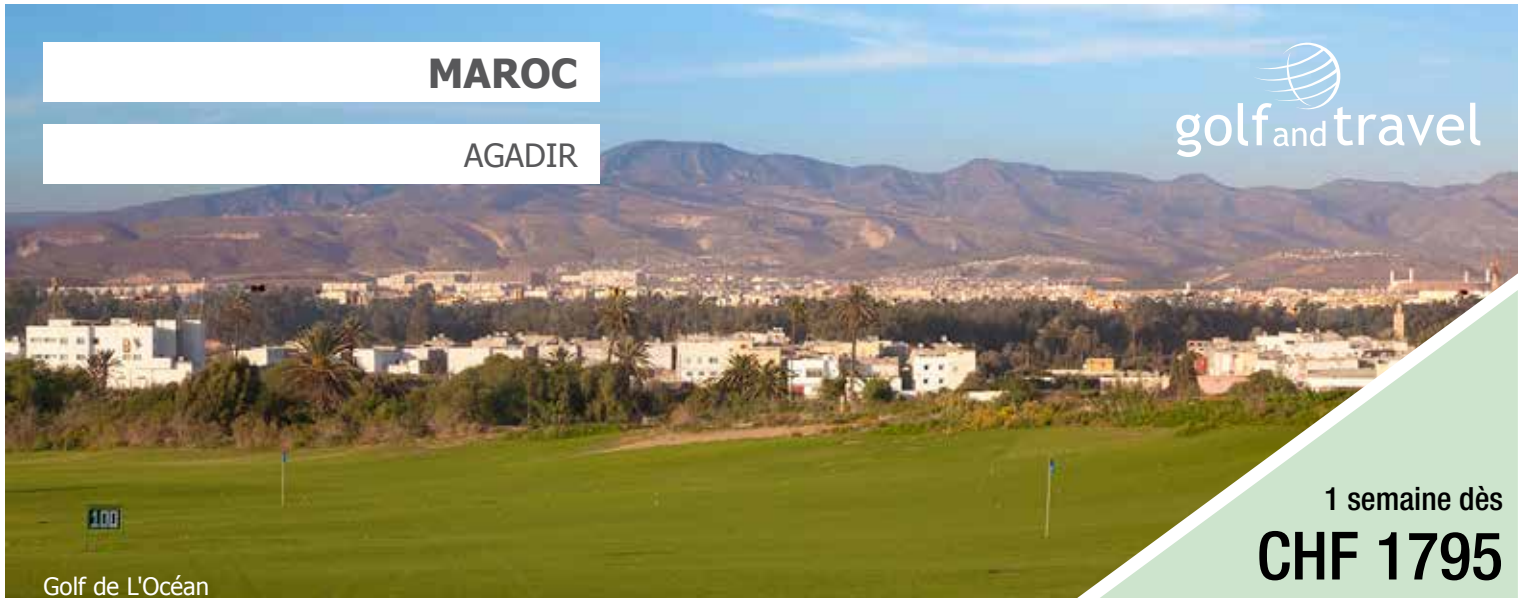
Golf de L'Océan