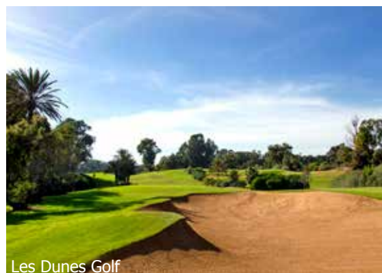
Les Dunes Golf