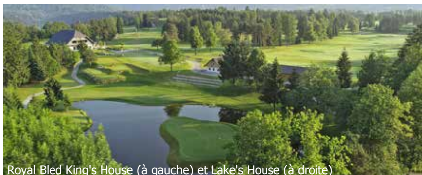
Royal Bled King's House (à gauche) et Lake's House (à droite)

Golf est le plus ancien et le plus grand parcours de golf de Slovénie. Ses origines remontent à 1937 et de nombreux visiteurs affirment qu'il s'agit de l'un des plus beaux terrains de golf d'Europe. Il y a aussi une académie de golf moderne avec un terrain d'entraînement qui se trouve dans un endroit unique avec une vue magnifique sur les montagnes.