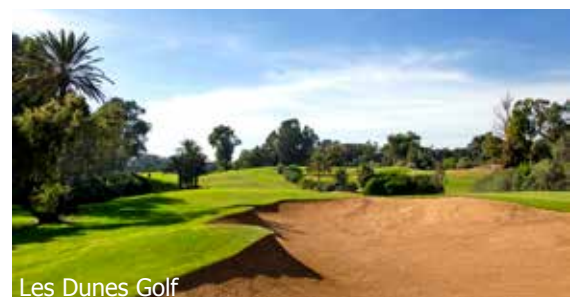
Les Dunes Golf