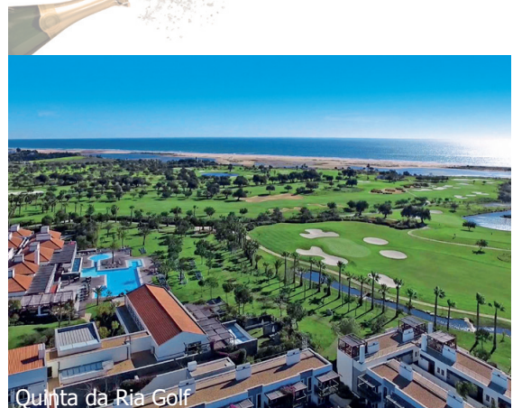
Quinta da Ria Golf

Geplanter Reiseleiter Cornel Merki (Änderungen vorbehalten!)