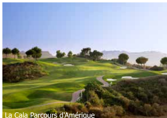
La Cala Parcours d'Amérique