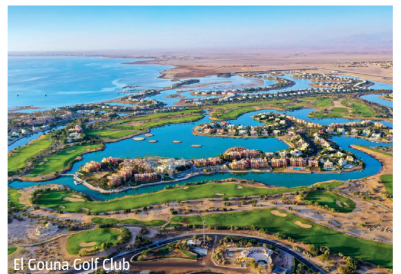
El Gouna Golf Club

WICHTIG: Limitierte Anzahl Flugplätze zu oben stehenden Konditionen. Ist die berechnete Buchungskategorie nicht mehr verfügbar, behalten wir uns vor, den Flugzuschlag aufzurechnen. Früh buchen lohnt sich! nl350/0