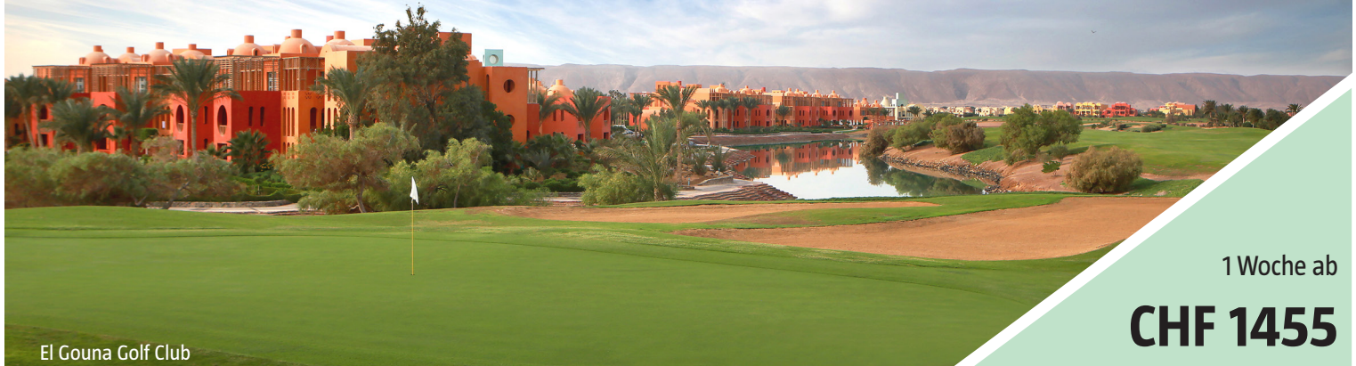
El Gouna Golf Club