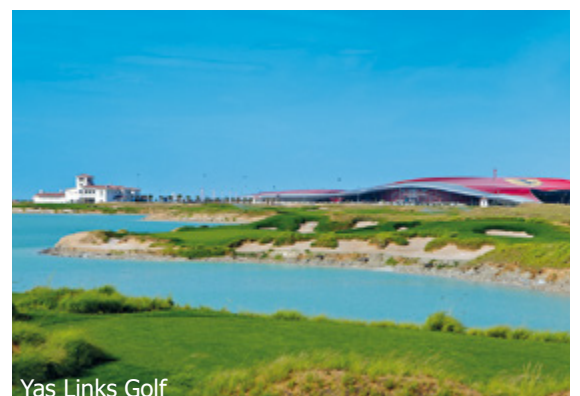
Yas Links Golf

WICHTIG: Limitierte Anzahl Flugplätze zu oben stehenden Konditionen. Ist die berechnete Buchungsklasse nicht mehr verfügbar, behalten wir uns vor, den Flugzuschlag aufzurechnen. Früh buchen lohnt sich! d_0ar600