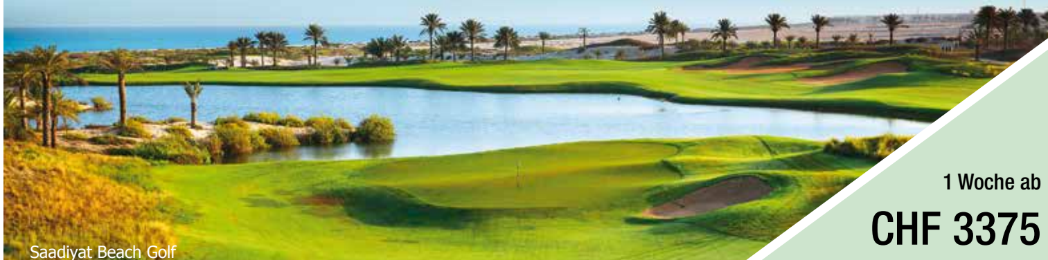
Saadiyat Beach Golf