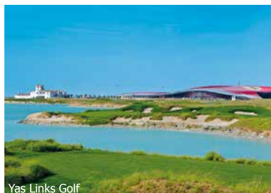
Yas Links Golf

WICHTIG: Limitierte Anzahl Flugplätze zu oben stehenden Konditionen. Ist die berechnete Buchungsklasse nicht mehr verfügbar, behalten wir uns vor, den Flugzuschlag aufzurechnen. Früh buchen lohnt sich! nb780/0