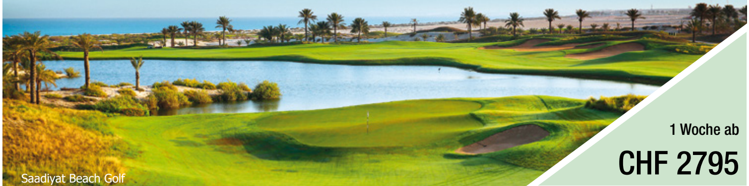
Saadiyat Beach Golf