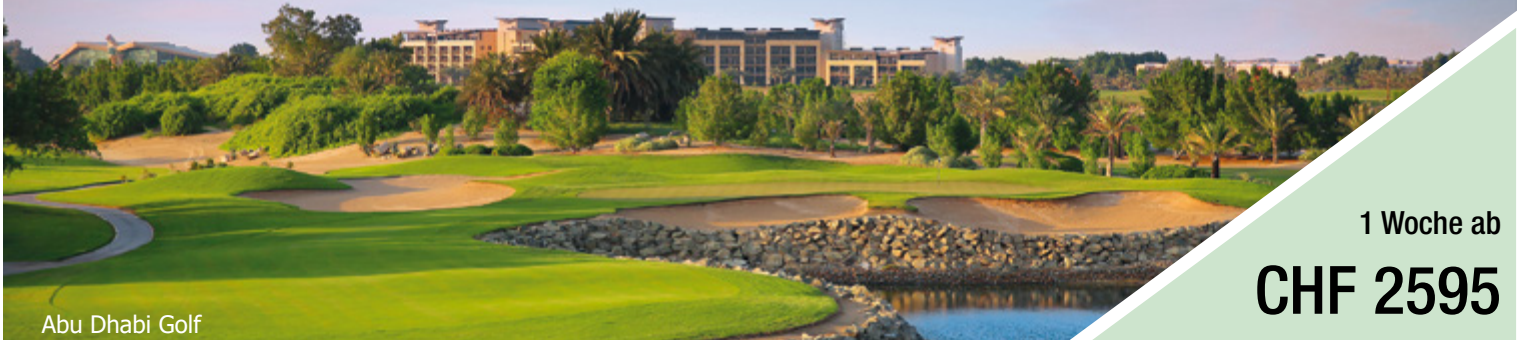
Abu Dhabi Golf