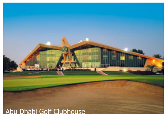
Abu Dhabi Golf Clubhouse

WICHTIG: Limitierte Anzahl Flugplätze zu oben stehenden Konditionen. Ist die berechnete Buchungskategorie nicht mehr verfügbar, behalten wir uns vor, den Flugzuschlag aufzurechnen. Früh buchen lohnt sich! d_0ar600