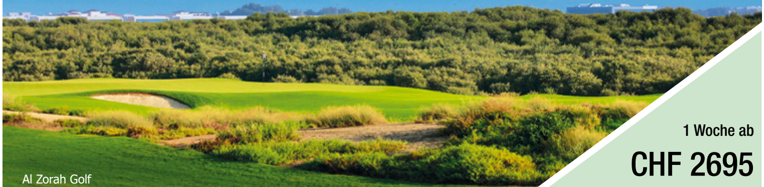
Al Zorah Golf