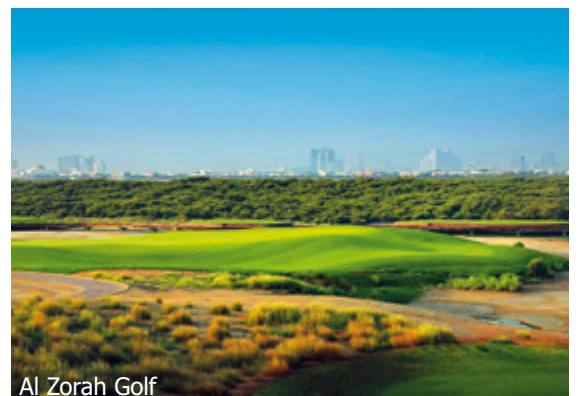
Al Zorah Golf

WICHTIG: Limitierte Anzahl Flugplätze zu oben stehenden Konditionen. Ist die berechnete Buchungsklasse nicht mehr verfügbar, behalten wir uns vor, den Flugzuschlag aufzurechnen. Früh buchen lohnt sich! d_0ar600