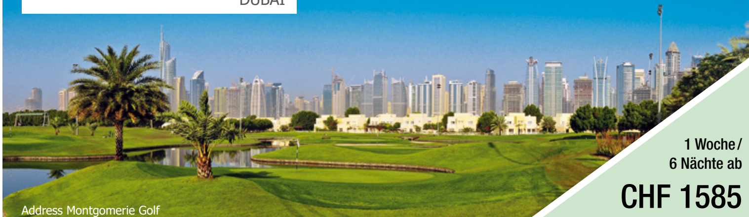
Address Montgomerie Golf