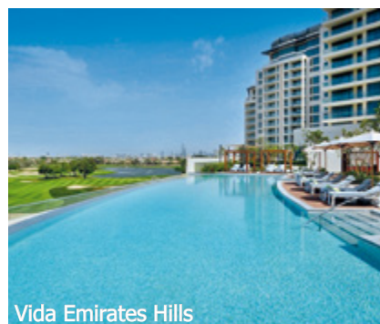
Vida Emirates Hills