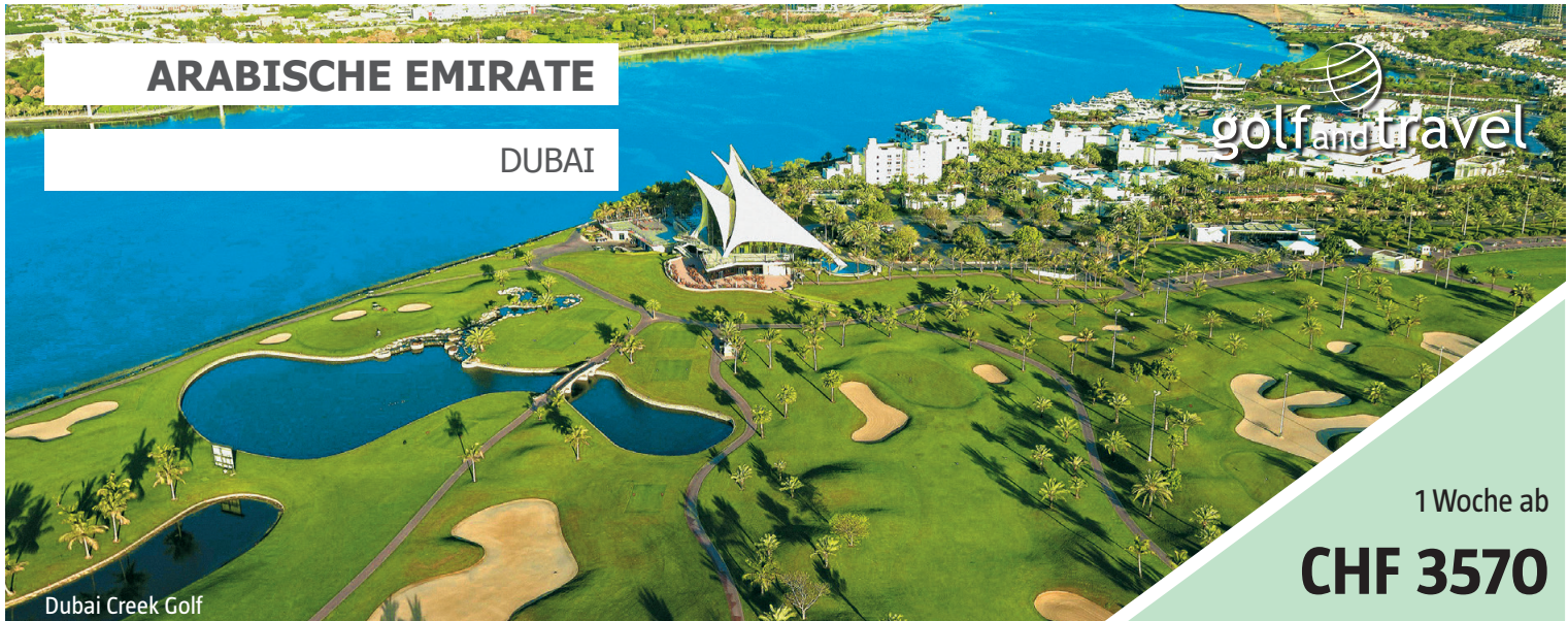
Dubai Creek Golf