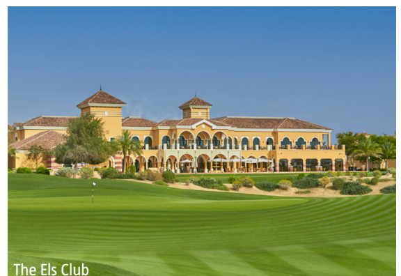
The Els Club

WICHTIG: Limitierte Anzahl Flugplätze zu oben stehenden Konditionen. Ist die berechnete Buchungskategorie nicht mehr verfügbar, behalten wir uns vor, den Flugzuschlag aufzurechnen. Früh buchen lohnt sich! nl700/0