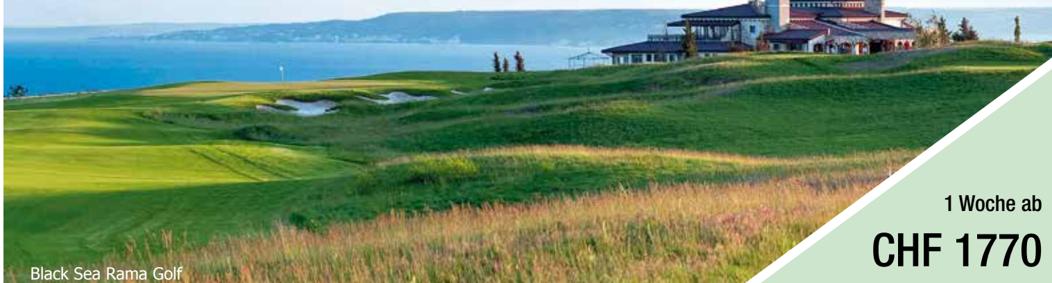
Black Sea Rama Golf