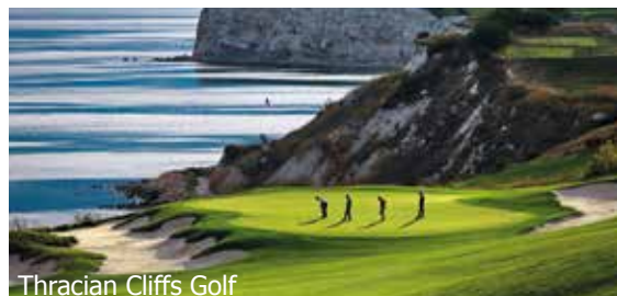
Thracian Cliffs Golf

WICHTIG: Limitierte Anzahl Flugplätze zu oben stehenden Konditionen. Ist die berechnete Buchungskategorie nicht mehr verfügbar, behalten wir uns vor, den Flugzuschlag aufzurechnen. Früh buchen lohnt sich! nb400/0