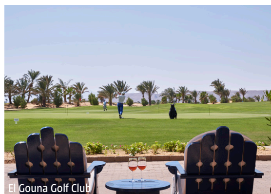
El Gouna Golf Club