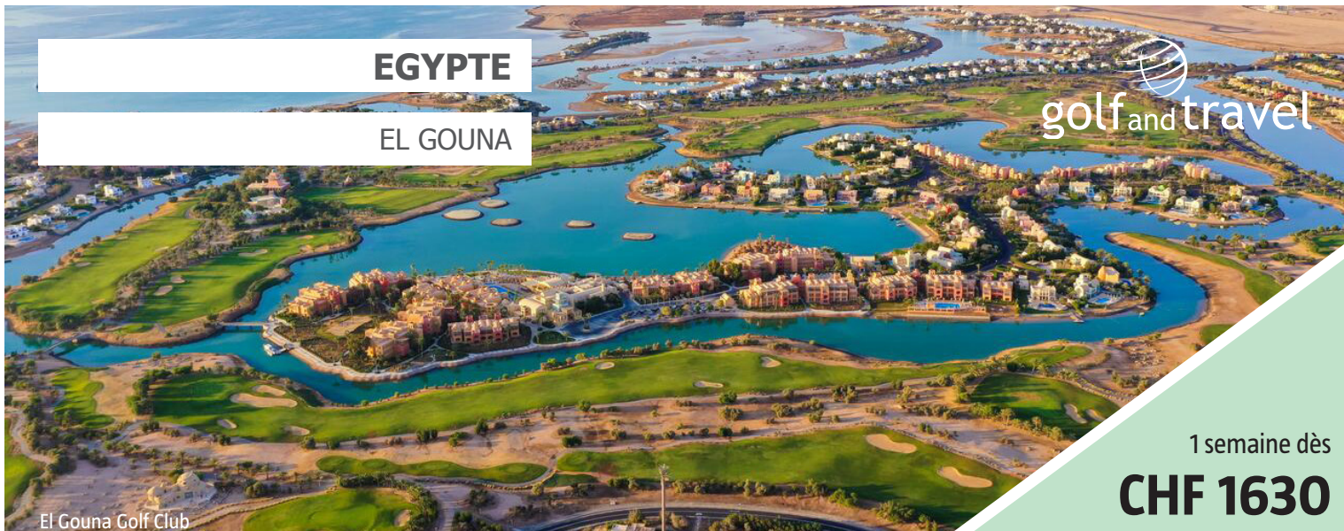
El Gouna Golf Club