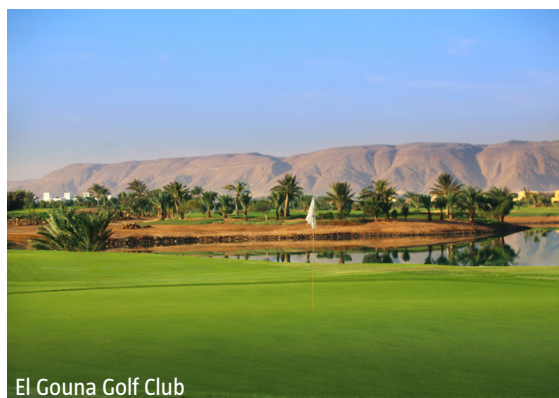
El Gouna Golf Club