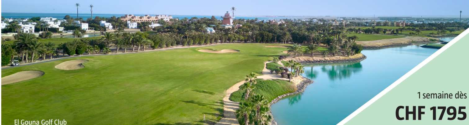
El Gouna Golf Club