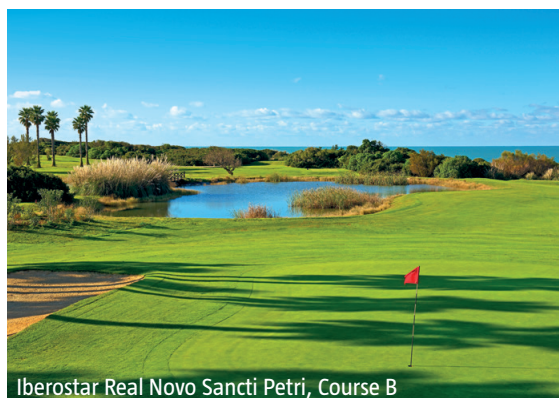
Iberostar Real Novo Sancti Petri, Course B