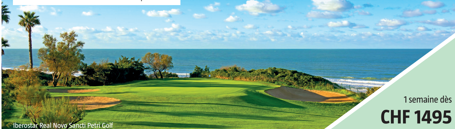
Iberostar Real Novo Sancti Petri Golf