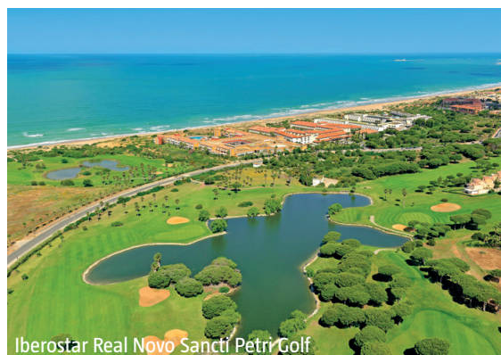
Iberostar Real Novo Sancti Petri Golf