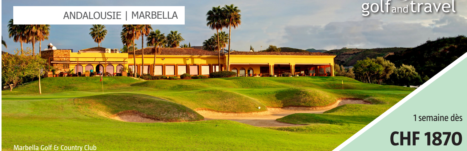
Marbella Golf & Country Club