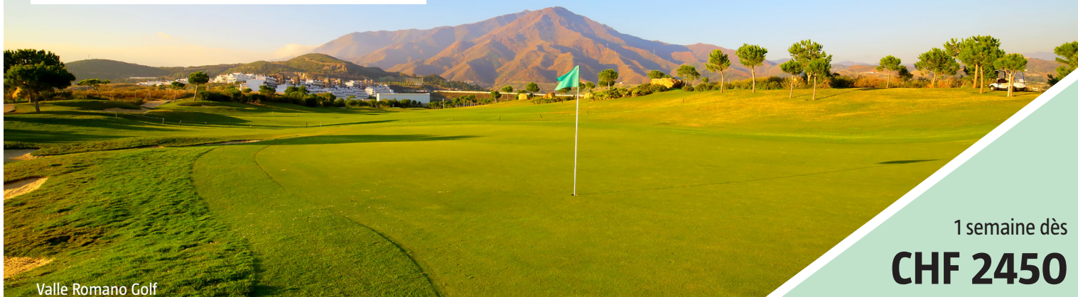
Valle Romano Golf