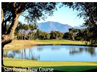
San Roque New Course