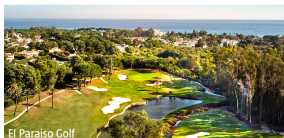
El Paraiso Golf