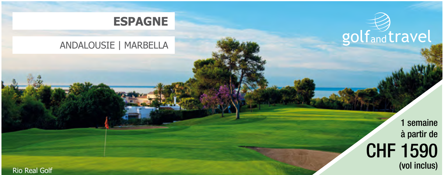
Rio Real Golf

1 semaine à partir de CHF 1590 (vol inclus)