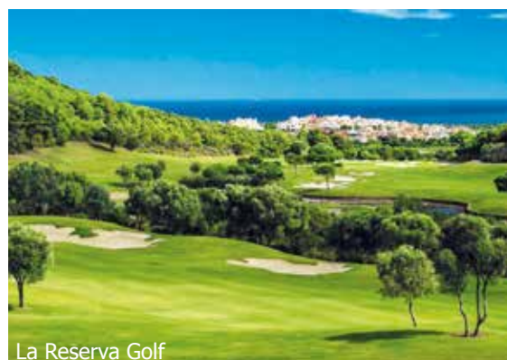
La Reserva Golf

IMPORTANT: Nombre limité de billets d'avion aux conditions ci-dessus. Si la classe de réservation calculée n'est plus disponible, nous nous réservons le droit d'ajuster une éventuelle surcharge de vol. Réserver de bonne heure vaut la peine! ad250/400