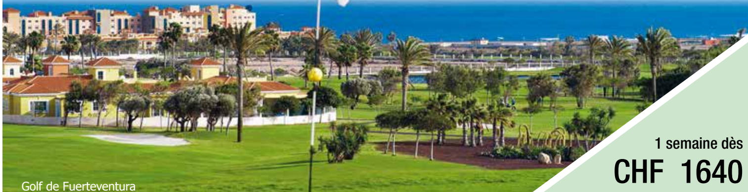
Golf de Fuerteventura