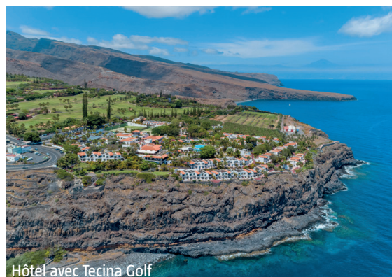
Hôtel avec Tecina Golf

INCLUS pp 1 green fee Tecina Golf, 1 billet passager, 1 billet véhicule de tourisme (base 2 pers.) aller/retour Tenerife–La Gomera (hors séjour)