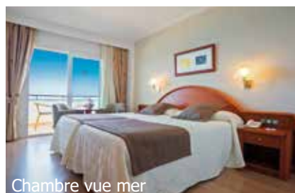
Chambre vue mer

IMPORTANT: Nombre limité de billets d'avion aux conditions ci-dessus. Si la classe de réservation calculée n'est plus disponible, nous nous réservons le droit d'ajuster une éventuelle surcharge de vol. Réserver de bonne heure vaut la peine! ar200/250