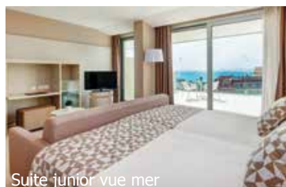
Suite junior vue mer

Sport/bien-être: Spa (oct-avr), jacuzzi, sauna, bain de vapeur, salle de fitness.