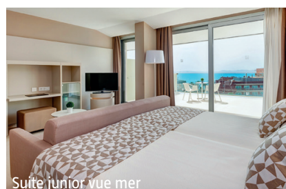
Suite junior vue mer

IMPORTANT: Nombre limité de billets d'avion aux conditions ci-dessus. Si la classe de réservation calculée n'est plus disponible, nous nous réservons le droit d'ajuster une éventuelle surcharge de vol. Réserver de bonne heure vaut la peine! nb250/250