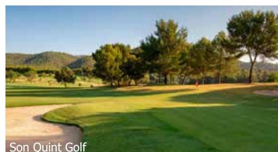
Son Quint Golf

IMPORTANT: Nombre limité de billets d'avion aux conditions ci-dessus. Si la classe de réservation calculée n'est plus disponible, nous nous réservons le droit d'ajuster une éventuelle surcharge de vol. Réserver de bonne heure vaut la peine! ar200/250