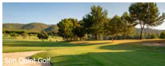
Son Quint Golf