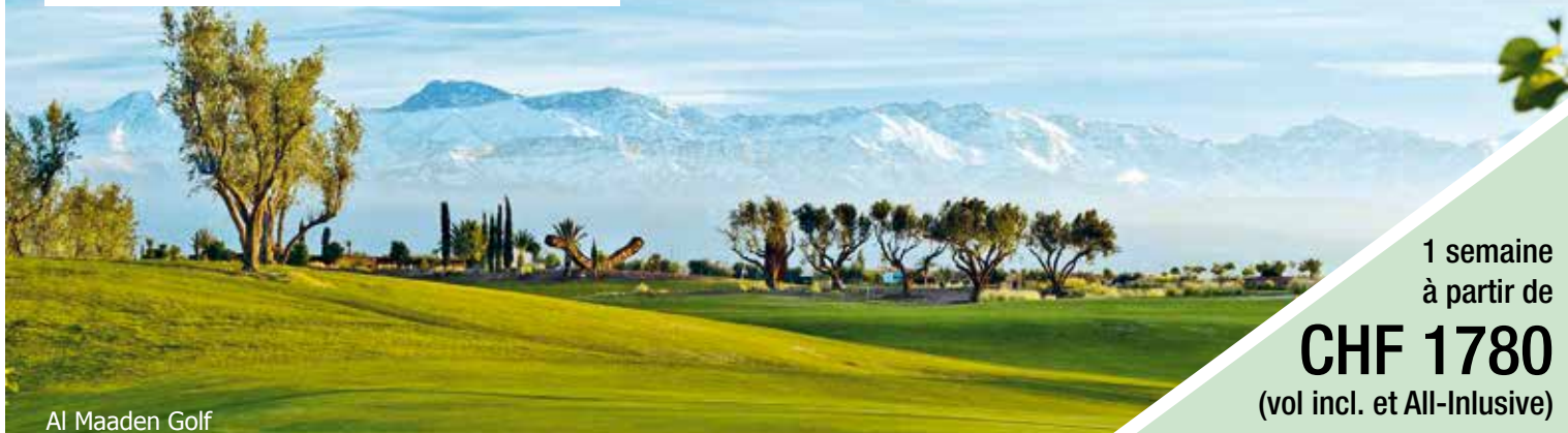
Al Maaden Golf