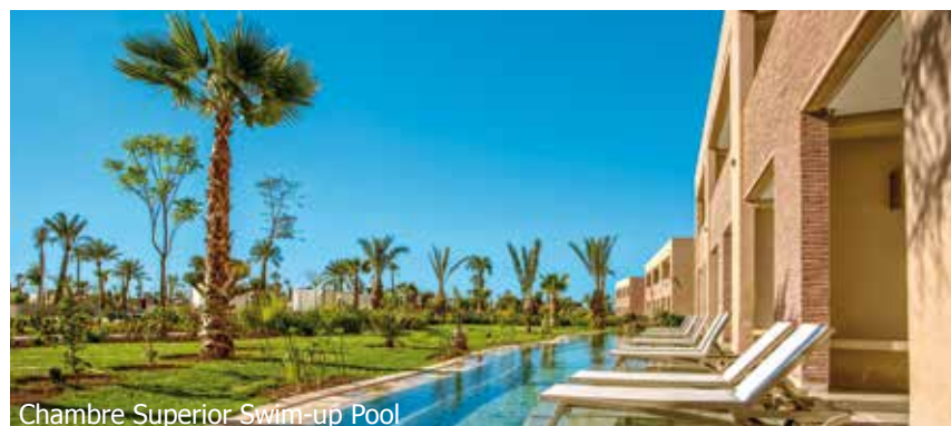
Chambre Superior Swim-up Pool