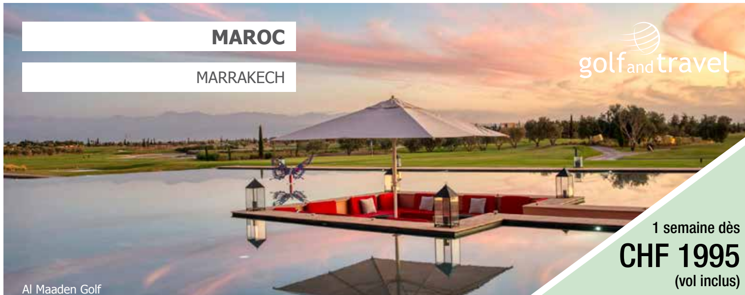
Al Maaden Golf