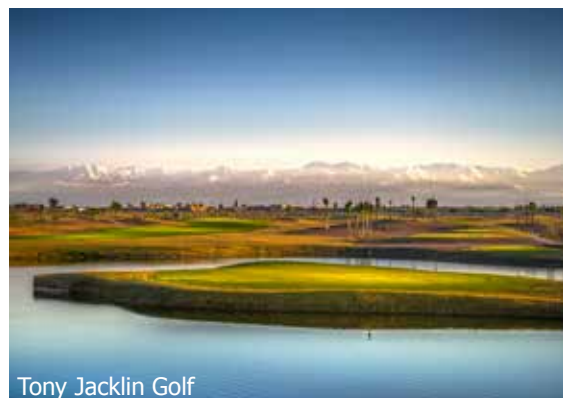
Tony Jacklin Golf