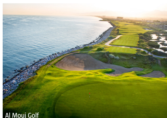
Al Mouj Golf

IMPORTANT: Nombre limité de billets d'avion aux conditions ci-dessus. Si la classe de réservation calculée n'est plus disponible, nous nous réservons le droit d'ajuster une éventuelle surcharge de vol. Réserver de bonne heure vaut la peine! ad850/0