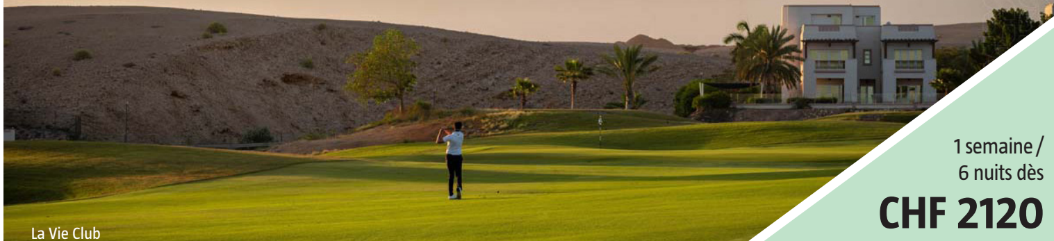
La Vie Club