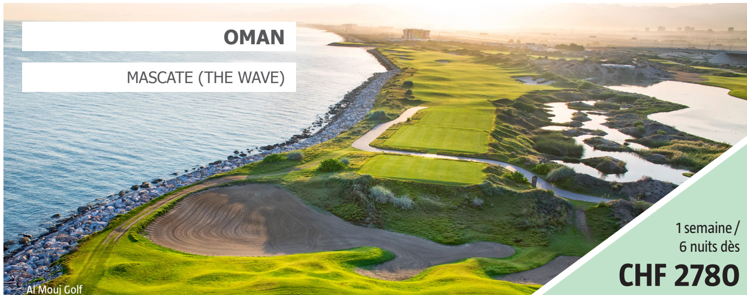
Al Mouj Golf