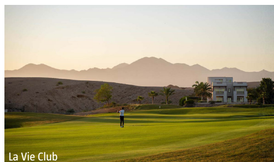
La Vie Club