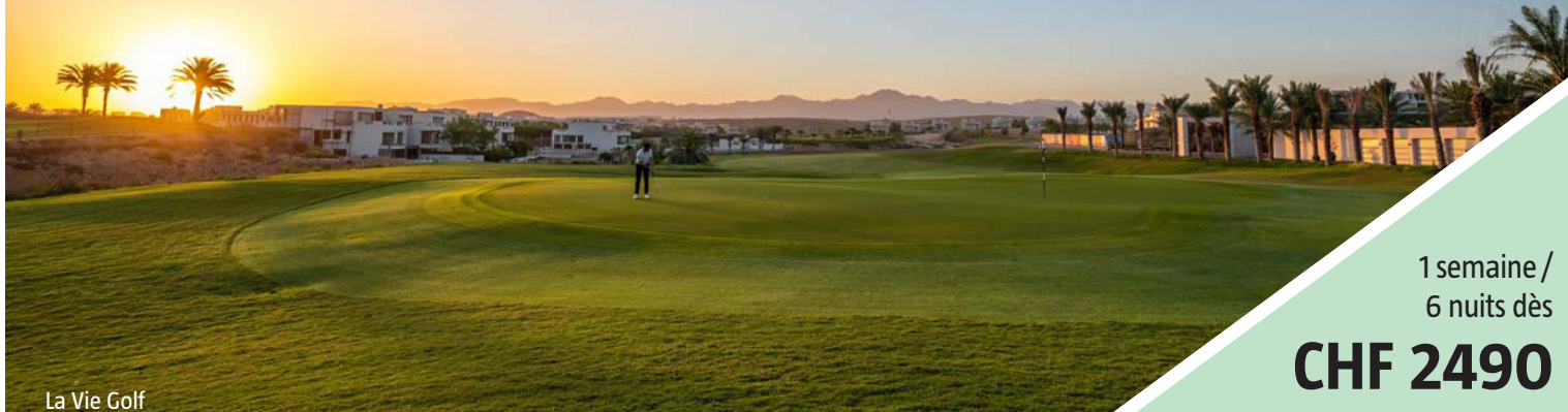
La Vie Golf