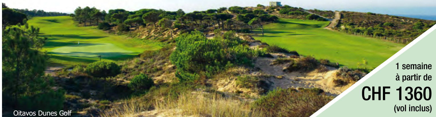
Oitavos Dunes Golf

1 semaine à partir de CHF 1360 (vol inclus)