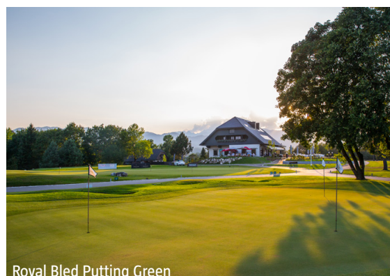
Royal Bled Putting Green