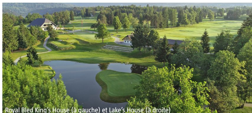
Royal Bled King's House (à gauche) et Lake's House (à droite)

de golf de Slovénie. Ses origines remontent à 1937 et de nombreux visiteurs affirment qu'il s'agit de l'un des plus beaux terrains de golf d'Europe. Il y a aussi une académie de golf moderne avec un terrain d'entraînement qui se trouve dans un endroit unique avec une vue magnifique sur les montagnes.