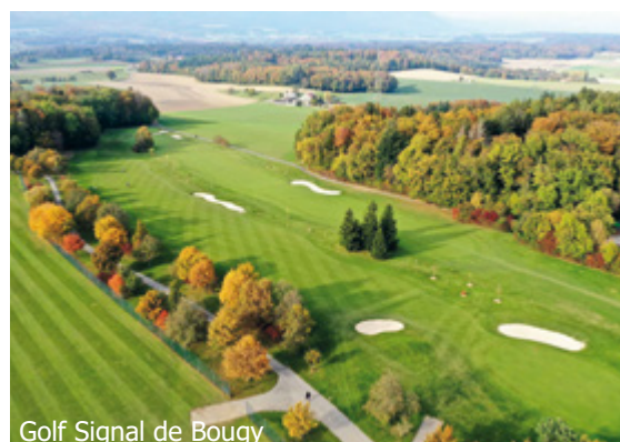
Golf Signal de Bougy