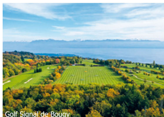
Golf Signal de Bougy