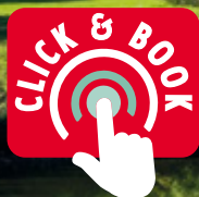
Golf de Lavaux