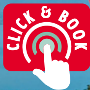
Golf Signal de Bougy