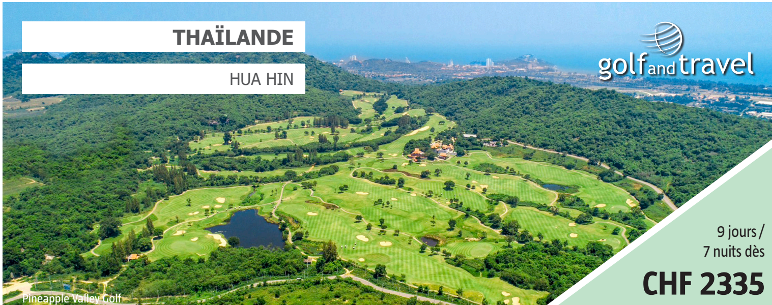
Pineapple Valley Golf