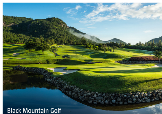
Black Mountain Golf

IMPORTANT: Nombre limité de billets d'avion aux conditions ci-dessus. Si la classe de réservation calculée n'est plus disponible, nous nous réservons le droit d'ajuster une éventuelle surcharge de vol. Réserver de bonne heure vaut la peine! ic800/0