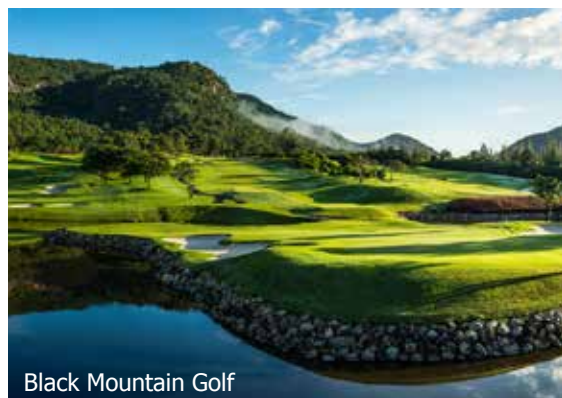
Black Mountain Golf

Genève–Bangkok via Zurich avec Swiss s.d.