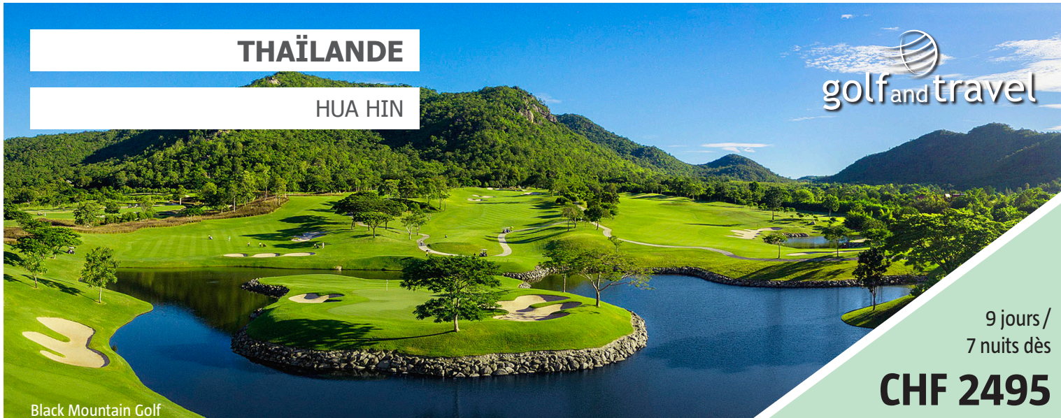
Black Mountain Golf