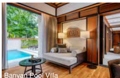
Banyan Pool Villa

Sport/bien-être: grand espace spa, 3 courts de tennis (1 avec projecteurs), centre de fitness, yoga et méditation. Location de VTT et grande offre de sports nautiques. Le Laguna Golf Course de 18 trous se trouve directement devant l'hôtel.