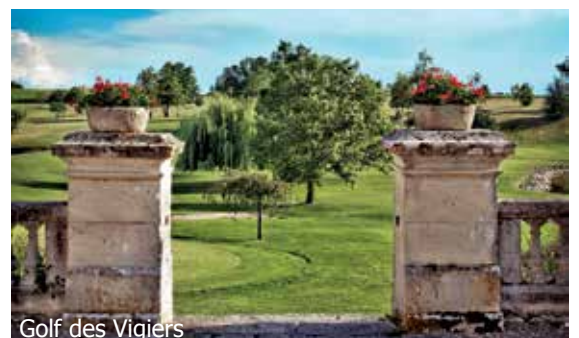
Golf des Vigiers

inkl. 1 Abendessen im Michelin-Restaurant «Les Fresques»* (3-Gang «Esprit du Chef» Menü, exkl. Getränke) 2 Abendessen im «Bistrot de Vigiers» (3-Gang Menü, exkl. Getränke)