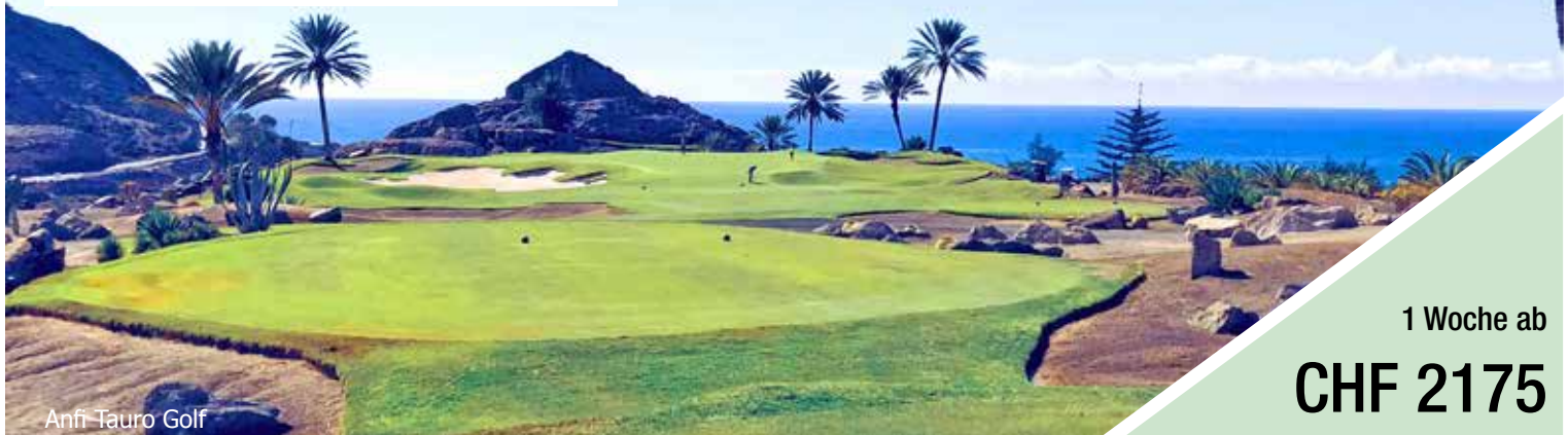
Anfi Tauro Golf