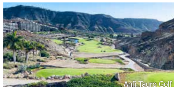
Anfi Tauro Golf

WICHTIG: Limitierte Anzahl Flugplätze zu oben stehenden Konditionen. Ist die berechnete Buchungskategorie nicht mehr verfügbar, behalten wir uns vor, den Flugzuschlag aufzurechnen. Früh buchen lohnt sich! ad400/300