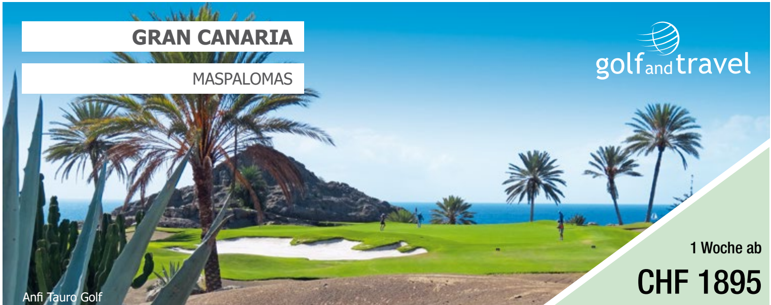
Anfi Tauro Golf